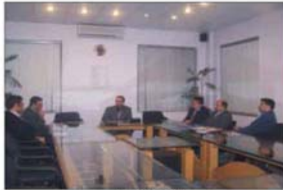
PRMP کی ٹیم کی بریفنگ

پنجاب ریورس مینجمنٹ پروگرام (PRMP) نے فیصل آباد میں عمل پندہ بہت سے انٹارمیشن سسٹمز کو پنجاب کے دوسرے اضلاع میں نافذ کرنے اور ہارنے میں دلچسپی کا اظہار کیا ہے۔ اس سلسلہ میں 17 جنوری 2007 کو انہوں نے SPU کا دورہ کیا جس کا مقصد یہ دیکھنا تھا کہ ڈیٹا انٹارمیشن سسٹمز سسٹمز کی طرح سے ڈیٹا انٹارمیشن میں عملہ F&P کی مدد کر رہا ہے۔ EDO ٹائٹلس و پلاننگ نے FMS پر ایک تفصیلی بریفنگ دی کہ کس طرح FMS بجٹ اور Releases کے مطابق عملہ کو تفصیلی اخراجات کی جانچ پڑتال میں مدد دے رہا ہے۔ EDO صاحب نے مزید وضاحت کرتے ہوئے بتایا ہے کہ اب ہم عملہ تعلیم میں ہر پرائمری سکول کیلئے بجٹ پر اپنی توجہ مرکوز کر رہے ہیں کہ کس طرح سے سکول کی ریلیز اور اخراجات کی معلومات لی جاسکتی ہیں۔