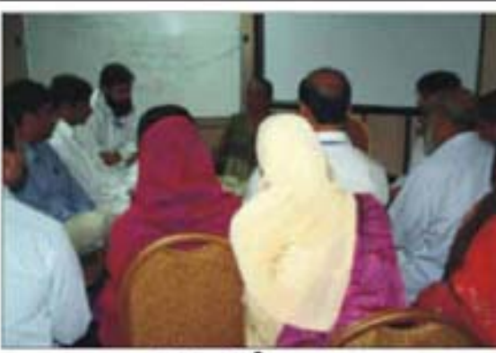
سری انکا میں ماہرین تعلیم کے ساتھ میٹنگ

انٹیلیٹیٹ آف رکنگ کی ایک 14 رکنی ٹیم نے سری انکا کا دورہ کیا۔ دورہ کا مقصد سری انکا کا نظام تعلیم دیکھنا تھا جہاں شرح خواندگی 96% ہے، جو کہ جنوبی ایشیاء کے ممالک میں سب سے زیادہ ہے۔ سری انکا کا تعلیمی نظام بہت سے حوالوں سے مختلف ہے، پھرے ملک کا نصاب ایک ہے چاہے وہ گورنمنٹ سکول کا حصہ ہو یا پرائیویٹ۔ وہ مفت تعلیم مفت کتابیں اور مفت یونیفارم دیتے ہیں۔ گورنمنٹ کے ننھو پائونڈ اساتذہ کے ساتھ ساتھ رضا کار اساتذہ کی موجودگی بھی تہذیب کی اہم وجہ ہے۔ اساتذہ کو تنقیدی بنانا اور اس کو قائم رکھنا اور موثر مانیٹرنگ سسٹمز میں کوئی تبدیلی نہیں کرنا دیا کرتی ہے۔ مذہبی تعلیم نصاب کا حصہ ہے۔ تعلیمی اصلاحات کی روشنی میں ترقیاتی ماڈل بنانے کے ہیں اور اساتذہ کو ان کے مطابق تربیت فراہم کی جاتی ہے۔ عملہ تعلیم سٹی ڈسٹرکٹ اسٹریٹیجک پالیسی یونٹ نے سری انکا کے ماہرین تعلیم کو ترقیاتی ماڈل اور ٹیچر ویڈیکٹیشن کیس جن کی سری انکا کے ماہرین نے بہت تعریف کی اور اس کے مواد کو بین الاقوامی معیار کے مطابق تیار کیا۔ یہ مطالعاتی دورہ دیگر ممالک کے نظام تعلیم کے تجزیاتی مطالعے کے حوالے سے بہت مفید تھا اور فیصل آباد میں نظام تعلیم کو بہتر بنانے کے حوالے سے کافی کار