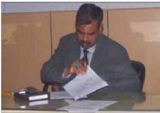
DEO سیکرٹری اساتذہ کی Job Discription پر دستخط کر رہے ہیں

سٹی ڈسٹرکٹ گورنمنٹ فیملی آبادی زیادہ جو ابھرتی اور باصلاحیت بننے کے لیے بہت زیادہ اقدامات کر رہی ہے۔ اس میں موجود تمام ملازمین کی Job Description کے ساتھ ساتھ امیدواران ملازمت کی Person Specification بھی شامل ہے۔ اس وقت ہم تیار کی گئی Job Description کو حتمی کر رہے ہیں اور اس کی افادیت کو مزید موثر کرنے کیلئے اہلی قیادت اور ملازمین کی مختلف ایسوسی ایشنز سے ان پر دستخط لے رہے ہیں۔ محکمہ تعلیم فیملی آبادی کے "ٹیچنگ سٹاف" کے Job Description کے مسودہ کو حتمی کرنے کیلئے کافی وقت لگایا جا رہا ہے۔